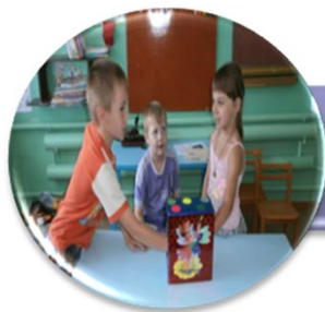
Игры и упражнения